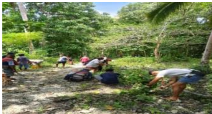
Gambar 5. Partisipasi Masyarakat

Kolaborasi antara kegiatan kebersihan dan perawatan fasilitas umum membentuk rangkaian aktivitas yang menyeluruh dan menyenangkan bagi warga. Fenomena peningkatan partisipasi yang terjadi dari minggu ke minggu juga dapat dijelaskan melalui teori perubahan perilaku sosial, khususnya konsep social proof, di mana keterlibatan seseorang terdorong oleh pengamatan terhadap partisipasi orang lain di lingkungan sosial yang sama.