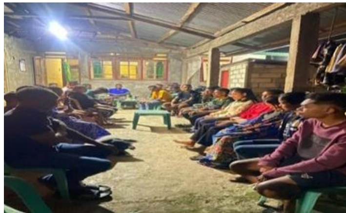
Gambar 4. Pembentukan kelompok peduli lingkungan (KPL)

Pendekatan PRA memungkinkan masyarakat untuk bertransformasi dari penerima manfaat menjadi pelaku aktif dalam menjaga lingkungan. Metode ini mendorong terjadinya perubahan perilaku sosial melalui mekanisme kolektif, menciptakan rasa kepemilikan, dan memperkuat norma sosial positif terkait kebersihan dan pengelolaan lingkungan.