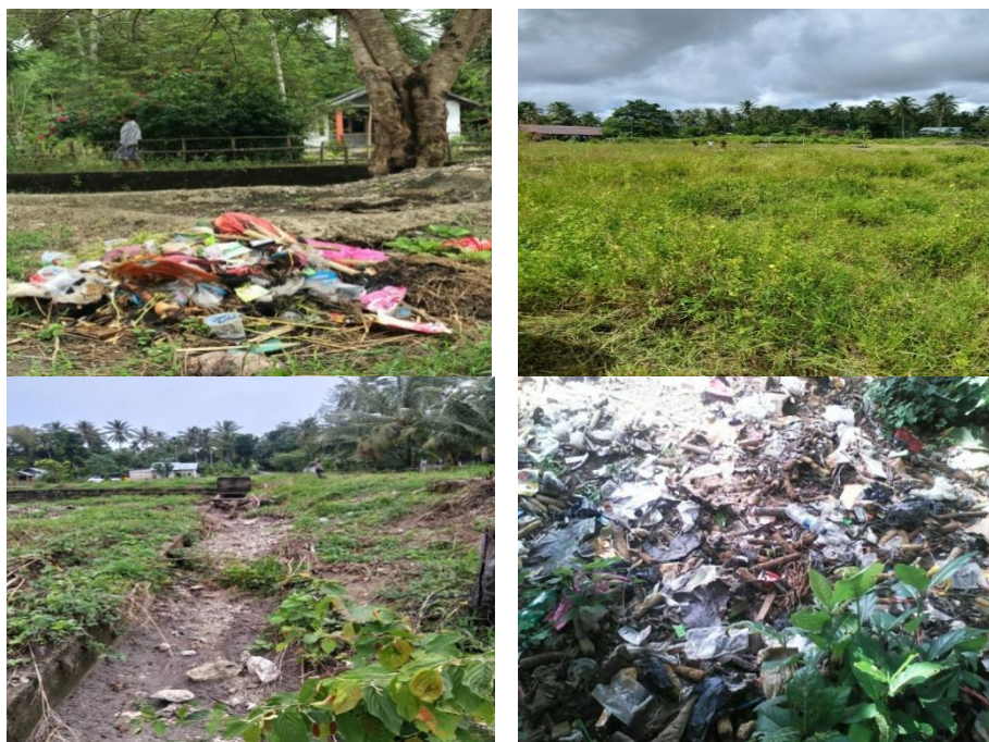
Gambar 1: Sudut Desa Nekmese yang Kotor

Desa Nekmese, Kecamatan Amarasi Selatan, Kabupaten Kupang, Nusa Tenggara Timur, merepresentasikan kompleksitas permasalahan tersebut. Dengan luas wilayah 18,75 km 2 dan populasi sebanyak 1.245 jiwa yang tersebar dalam 325 kepala keluarga, desa ini menghadapi tantangan signifikan dalam pengelolaan lingkungan. Data baseline menunjukkan bahwa 65% masyarakat masih membuang sampah secara tidak terkelola, hanya 23% rumah tangga memiliki sistem pembuangan sampah yang sesuai standar, dan 42% keluarga belum memiliki akses terhadap fasilitas sanitasi yang layak (Badan Pusat Statistik Kabupaten Kupang, 2024a). Situasi ini diperburuk oleh keterbatasan infrastruktur pengelolaan sampah, dengan rasio tempat pembuangan sampah komunal hanya 1:85 kepala keluarga, serta tingkat kepatuhan terhadap sanitasi yang masih rendah (28,5%).