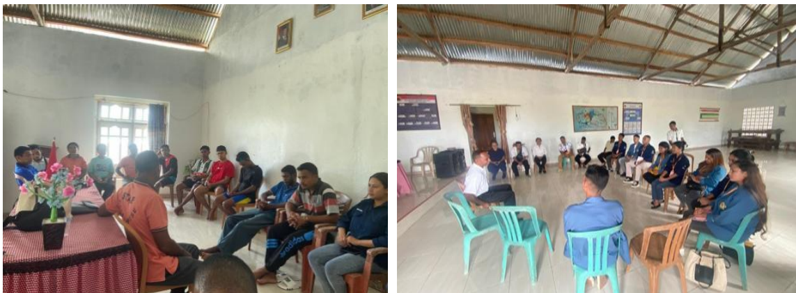
Gambar 3. Tahap Sosialisasi Dan Mobilisasi Masyarakat

Tahap awal berupa sosialisasi dan mobilisasi masyarakat menggunakan pendekatan Participatory Rural Appraisal (PRA). Kegiatan ini bertujuan untuk meningkatkan kesadaran masyarakat sekaligus mengajak mereka terlibat aktif dalam menjaga kebersihan lingkungan. Sosialisasi dilakukan melalui pertemuan di tingkat dusun, memastikan bahwa informasi tersampaikan secara merata dan dapat diterima oleh berbagai kelompok masyarakat. Melalui diskusi kelompok, masyarakat diberdayakan untuk mengidentifikasi persoalan lingkungan di sekitar mereka dan bersama-sama mencari solusi kolektif. Dari pelaksanaan kegiatan ini, tingkat partisipasi masyarakat mengalami peningkatan signifikan dari minggu ke minggu. Data menunjukkan bahwa jumlah peserta meningkat dari 20 orang di minggu pertama, menjadi 32 di minggu kedua (peningkatan 60%), 42 orang di minggu ketiga (110%), dan mencapai 50 peserta di minggu keempat (150%). Kenaikan ini menjadi indikator keberhasilan metode PRA dalam menciptakan ruang partisipasi aktif yang inklusif dan berkelanjutan.