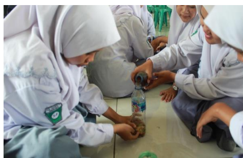
Gambar 4. Praktik Pembuatan Ecoenzym

Praktik ecoenzym termasuk dalam kegiatan aktualisasi lingkungan dalam proses pembelajaran, sehingga dapat mempengaruhi literasi lingkungan (Sumarmi, Putra, Mutia, et al., 2024). Praktik ecoenzym terbukti mampu mengurangi permasalahan sampah organik (Sumarmi et al., 2025). Teori edgar dale diintegrasikan dalam proses praktik ecoenzym (Lee, S.J., Reeves, 2017). Selama proses pengumpulan sampah organik berupa sisa buah-buahan, secara tidak langsung siswa memperoleh pengalaman belajar mengenai mendaur ulang sampah organik. Hal ini terbukti bahwa pengalaman belajar tidak hanya meningkatkan literasi lingkungan, namun juga membentuk sikap peduli lingkungan siswa (Situmorang et al., 2020; Torkar, 2014). Pengalaman belajar mengenai pengelolaan lingkungan akan memberikan stimulus bagi siswa untuk menjaga kelestarian lingkungan (Yfantidou et al., 2025).