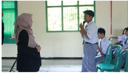
Gambar 3. Pemberian Quiz Literasi Lingkungan