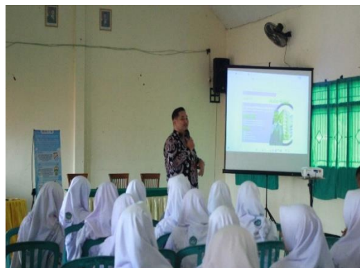
Gambar 2. Presentasi Materi oleh Narasumber

Pengabdian dilakukan di MAN 5 Jombang dan dihadiri 39 peserta yang didampingi oleh guru wali kelas. Pemateri dihadiri oleh dua dosen Pendidikan Geografi yang memiliki keahlian dalam bidang pendidikan geografi dan pendidikan lingkungan. Materi yang disampaikan meliputi pengenalan dasar-dasar literasi lingkungan, pentingnya pengelolaan lingkungan, dan prinsip 4R ( Reduce, Reuse, Recycle, Replace ). Pembelajaran dengan mengintegrasikan pendidikan lingkungan dapat meningkatkan literasi lingkungan siswa (Febriasari & Supriatna, 2017; Sunarto, 2023). Hal ini sejalan dengan temuan pada penelitian terdahulu bahwa implementasi berpengaruh pada perubahan perilaku manusia (Mahsun et al., 2025; Wibowo et al., 2023). Pendidikan lingkungan tidak hanya meningkatkan literasi lingkungan, namun juga dapat meningkatkan kepedulian siswa terhadap lingkungan (Henukh et al., 2025). Terdapat temuan pada penelitian terdahulu yang menyatakan bahwa pendidikan lingkungan dapat membangun pola pikir kelingkungan (Gesthuizen et al., 2025). Selain itu, pendidikan lingkungan dinilai cukup membantu dalam pembentukan sumber daya manusia dalam hal menyelesaikan permasalahan lingkungan (Ibáñez et al., 2020).