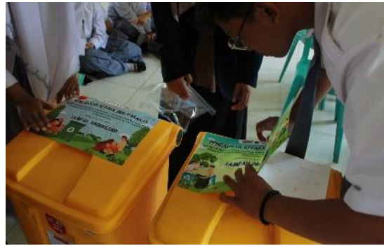
Gambar 7. Labelling Tempat Sampah