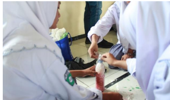
Gambar 6. Praktik Pembuatan Ecobrick