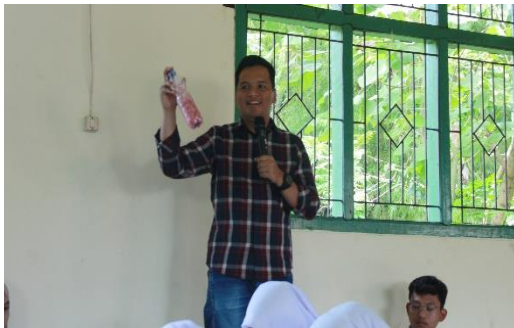
Gambar 5. Sosialisasi Pembuatan Ecobrick

Pembuatan ecobrick tidak hanya berfungsi sebagai solusi teknis pengelolaan sampah, namun dapat menjadi pendekatan edukatif (Suhendri, 2022). Praktik ecobrick selain menambah skill baru juga mendorong siswa untuk selektif dan kreatif dalam penggunaan dan daur ulang sampah. Penggunaan ecobrick , dalam konteks kurikulum dapat diintegrasikan dalam bagian Project Based Learning yang mengedepankan keterlibatan aktif siswa melalui pembelajaran berbasis proyek (Febriasari & Supriatna, 2017; Nursanti Fia, Fitriyani, Indriani, 2024). Selain itu, praktik ecobrick juga mendukung indikator Sekolah Adiwiyata yang relevan dan berfokus terhadap perilaku dan budaya terhadap lingkungan (Nursanti Fia, Fitriyani, Indriani, 2024). Oleh karena itu, ecobrick tidak hanya produk daur ulang tetapi juga sarana strategis dalam menanamkan nilai-nilai keberlanjutan dalam pendidikan.