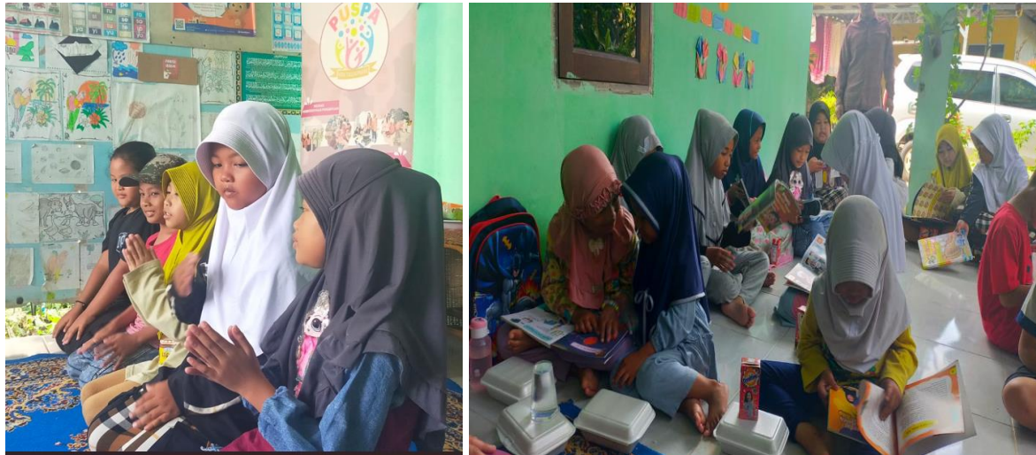
Gambar 5. Penampilan Seni Tari dan Aktivitas Literasi di TBM Kuntum Mekar

menunjukkan bahwa lingkungan literasi yang inklusif mampu menjadi wadah holistik bagi tumbuh kembang anak. Ruang yang aman dan apresiatif terbukti efektif dalam mendorong eksplorasi diri, mendukung keberagaman minat, serta memperkuat kepercayaan diri anak.