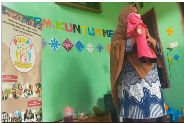
Gambar 3. Narasumber Menggunakan Media Boneka dalam Mendongeng

Pada sesi mendongeng, narasumber dari Forum PUSPA Hamidah menggunakan media boeka sebagai alat bantu visual untuk menyampaikan cerita, yang terbukti mampu menarik perhatian anak-anak sehingga mempermudah mereka memahami pesan moral yang disampaikan. Narasumber berhasil memanfaatkan teknik mendongeng secara ekspresif dengan cerita fabel bertema persahabatan, yang mengangkat tokoh binatang semut dan lebah sebagai simbol perilaku anak yang berbakti kepada orang tua dan memiliki kepedulian terhadap sesama. Pendekatan visual dan kinestetik ini tidak hanya menarik perhatian peserta, tetapi juga memperkuat pemahaman anak terhadap pesan yang disampaikan. Sesi tanya jawab setelah mendongeng menjadi sarana untuk mengukur pemahaman mereka terhadap isi cerita. Anak-anak tampak antusias dan mampu menjawab dengan baik, menandakan keterlibatan aktif dan pemahaman yang baik terhadap isi cerita. Sebagian besar peserta mampu menjelaskan kembali karakter tokoh dan nilai-nilai moral yang terkandung, seperti tolong-menolong, empati, kasih sayang, dan pentingnya kerja sama.