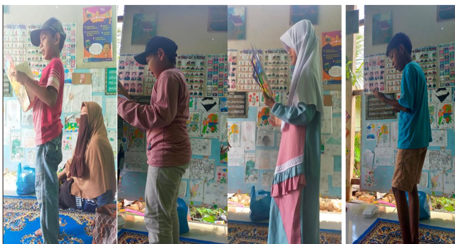
Gambar 4. Peserta Anak Membaca Nyaring Buku Pilihannya di Depan Kelompok

Kemudian dilanjutkan dengan sesi membaca nyaring ( read aloud ). Anak-anak diberikan kebebasan untuk memilih buku bacaan dari koleksi TBM. Selanjutnya, beberapa anak secara sukarela tampil bercerita buku bacaan pilihan mereka di depan teman-temannya. Aktivitas ini mendorong penguatan keterampilan komunikasi, membangun keberanian, dan menumbuhkan rasa percaya diri. Temuan ini sejalan dengan Mumtaziah et al. (2023) yang menyatakan bahwa metode membaca nyaring tidak hanya meningkatkan kemampuan literasi dasar, tetapi juga memberi dampak positif terhadap perkembangan sosial-emosional anak.