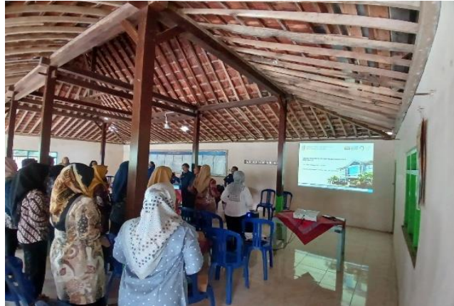
Gambar 1. Pemberian Materi

Pertemuan kedua yaitu pada hari Sabtu 14 Desember 2024 merupakan tahap simulasi pelaksanaan Posyandu Lansia dengan perwakilan lansia sebanyak 20 orang, dilanjutkan evaluasi yaitu pelaksanaan posttest dan diakhiri dengan penyerahan bantuan alat-alat kesehatan serta evaluasi pelaksanaan program secara keseluruhan. Melakukan diskusi akhir terhadap hasil evaluasi bersama para kader untuk memberikan masukan berdasarkan hasil evaluasi baik hasil evaluasi kognitif maupun skill, untuk rencana tindak lanjut perbaikan layanan.