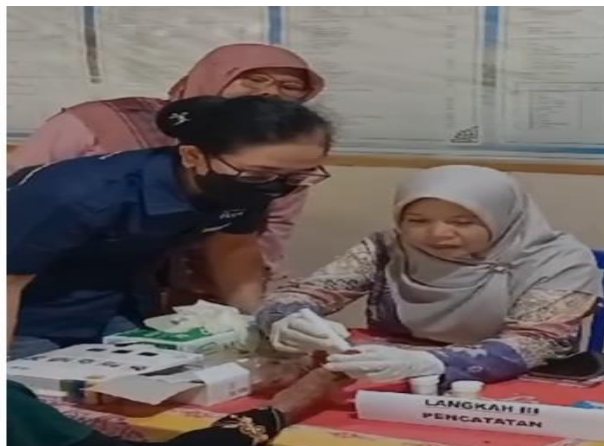
Gambar 2. Simulasi Posyandu Lansia

Pertemuan kedua yaitu pada hari Sabtu 14 Desember 2024 merupakan tahap simulasi pelaksanaan Posyandu Lansia dengan perwakilan lansia sebanyak 20 orang, dilanjutkan evaluasi yaitu pelaksanaan posttest dan diakhiri dengan penyerahan bantuan alat-alat kesehatan serta evaluasi pelaksanaan program secara keseluruhan. Melakukan diskusi akhir terhadap hasil evaluasi bersama para kader untuk memberikan masukan berdasarkan hasil evaluasi baik hasil evaluasi kognitif maupun skill, untuk rencana tindak lanjut perbaikan layanan.