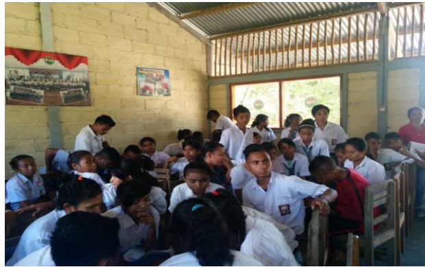
Gambar 3. Praktik Pembuatan Laporan Keuangan Sederhana

kolom "Tujuan Menabung" yakni untuk dana darurat, liburan, investasi kecil atau self reward . Kelompok kemudian melakukan analisis dan diskusi tentang menghitung presentase alokasi pengeluaran terhadap pemasukan serta mendiskusikan apakah target menabung tercapai serta apa saja pos pengeluaran yang bisa dihemat?. Kelompok juga diminta untuk menuliskan minimal 3 rekomendasi strategi pengelolaan agar saldo bulanan lebih sehat.