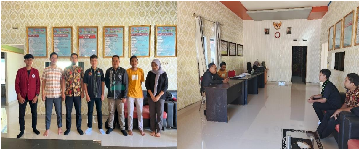
Gambar 1. Observasi Awal dengan Sekretaris Desa dan Ketua Karang Taruna

Selain itu, belum ada usaha yang menggabungkan barbershop dengan sport massage. Hal ini menjadi potensi besar yang bisa dikembangkan karena tren layanan pangkas rambut modern semakin mengarah pada pelayanan tambahan berupa pijat relaksasi. Inovasi barsage dipandang dapat memberikan nilai tambah dibandingkan kompetitor dan membuka pasar baru di wilayah pedesaan. Oleh karena itu perlu diberikan workshop tentang motivasi berwirausaha untuk menumbuhkan semangat pemuda untuk menciptakan lapangan pekerjaan.