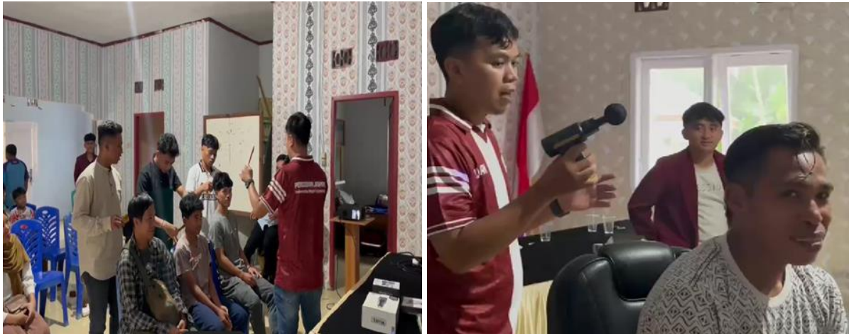
Gambar 3. Pelatihan Barsage

Setelah sosialisasi wirausaha dan strategi digital marketing kegiatan dilanjutkan pada pelatihan keterampilan teknis barsage. Pelatihan ini merupakan keterampilan mencukur yang dikombinasikan dengan sport massage sebagai inovasi baru dalam berwirausaha yang menghasilkan nilai tambah. Peserta diajarkan teknik dasar pemotongan rambut, penggunaan mesin cukur elektrik, teknik blending, pemeliharaan alat, serta penggunaan gun massage untuk. Latihan dilakukan secara langsung dengan model sehingga peserta memperoleh pengalaman nyata.