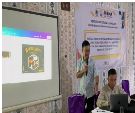
Gambar 2. Sosialisai wirausaha dan strategi digital marketing

Tahap pelaksanaan dimulai dengan kegiatan sosialisasi. Peserta diberikan pemahaman tentang pentingnya berwirausaha dalam meningkatkan perekonomian desa. Salah satu data yang disampaikan adalah bahwa negara dapat disebut maju apabila minimal 2% penduduknya berprofesi sebagai wirausahawan. Fakta ini memotivasi peserta agar mengubah pola pikir, tidak hanya menunggu peluang kerja formal seperti CPNS. Selain sosialisasi kewirausahaan, peserta juga memperoleh pelatihan digital marketing. Materi mencakup strategi branding, penggunaan media sosial untuk promosi, serta pengelolaan keuangan usaha sederhana. Digital marketing dipilih karena terbukti mampu meningkatkan daya saing usaha kecil, bahkan di wilayah pedesaan.