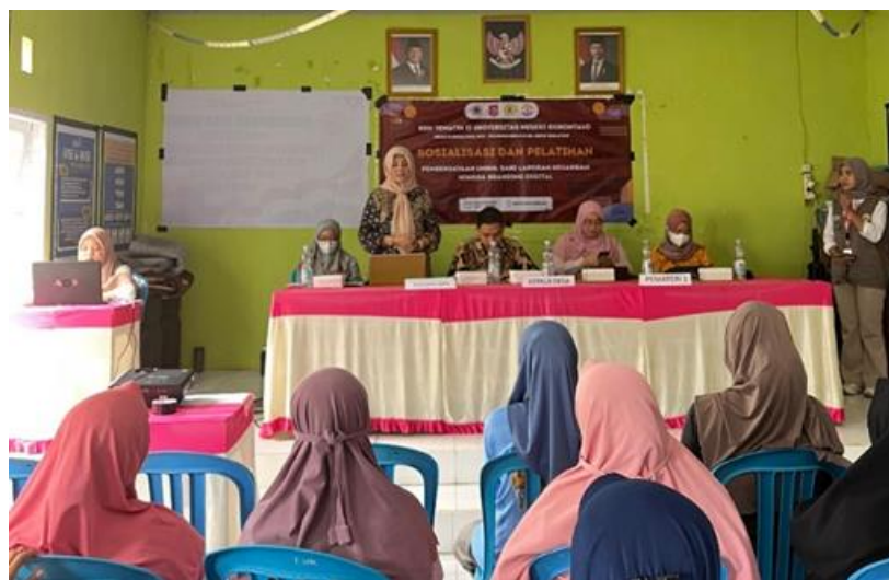
Gambar 2. Sosialisasi Dan Demonstrasi Lapangan Sebagai Media Transfer Praktik Budidaya Jagung Dan Nilam

Berdasarkan hasil pemetaan tersebut, program dirancang dalam tiga kluster kegiatan yang saling terintegrasi, yaitu penguatan budidaya jagung dan nilam, hilirisasi dan pemasaran produk, serta penguatan manajemen usaha. Kegiatan penguatan budidaya dilaksanakan melalui sosialisasi, pelatihan, dan demonstrasi lapangan mengenai teknik budidaya yang lebih efektif, mulai dari pemilihan benih, pengolahan lahan, pemeliharaan tanaman, hingga penanganan pascapanen. Pendekatan praktik lapangan dipilih agar peserta dapat memahami dan menerapkan materi yang diberikan secara langsung sesuai dengan kondisi lahan yang mereka miliki.