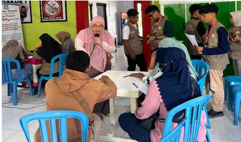
Gambar 3. Pendampingan Pembukuan Dan Manajemen Usaha Sebagai Tahap Penguatan Tata Kelola UMKM

Kegiatan sosialisasi dan demonstrasi lapangan menjadi media utama dalam transfer pengetahuan dan keterampilan budidaya kepada masyarakat, sebagaimana ditunjukkan pada Gambar 2. Sementara itu, proses pendampingan pembukuan dan manajemen usaha dilakukan secara berkala melalui konsultasi langsung dan kunjungan lapangan guna memastikan peserta mampu menerapkan materi yang telah diberikan dalam aktivitas usaha sehari-hari.