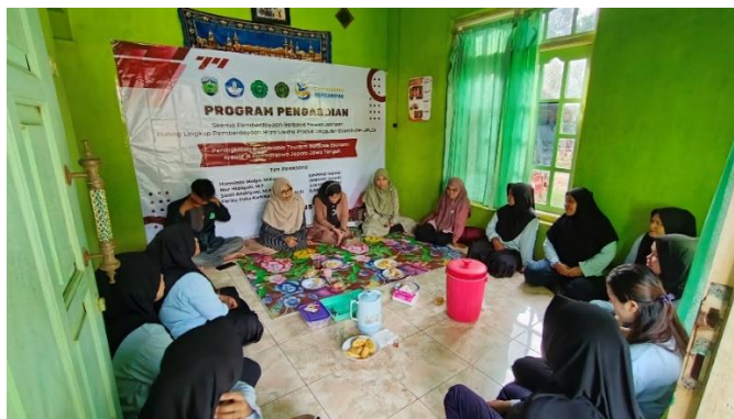
Gambar 2. Sosialisasi dan Koordinasi Pelatihan UMKM Putri Wali

Kegiatan selanjutnya berupa pelatihan inovasi dan diversifikasi produk olahan ikan. Peserta diberikan pelatihan praktik langsung dalam mengolah bahan baku lokal menjadi produk bernilai tambah seperti fish stick, pasta ikan, dan kerupuk ikan. Pelatihan dilakukan untuk meningkatkan kemampuan teknis peserta dalam pengolahan bahan baku, pengendalian kualitas produk, serta penentuan tekstur produk agar menghasilkan produk yang lebih berkualitas dan memiliki daya saing pasar. Pendekatan praktik langsung membantu peserta lebih mudah memahami tahapan produksi sehingga keterampilan dan kreativitas anggota UMKM mengalami peningkatan.