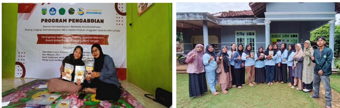
Gambar 6. Smart Packaging

Peningkatan kapasitas usaha juga terlihat pada aspek nilai tambah produk melalui penerapan konsep smart packaging. Peserta memperoleh wawasan baru mengenai pentingnya desain kemasan, identitas produk, dan informasi kandungan gizi dalam meningkatkan daya tarik serta kepercayaan konsumen. Penggunaan label produk yang lebih informatif dan desain kemasan yang lebih menarik membantu meningkatkan citra produk agar terlihat lebih profesional dan siap dipasarkan secara lebih luas. Inovasi kemasan tidak hanya berfungsi sebagai pelindung produk, tetapi juga menjadi strategi pemasaran untuk memperkuat branding UMKM berbasis potensi lokal.