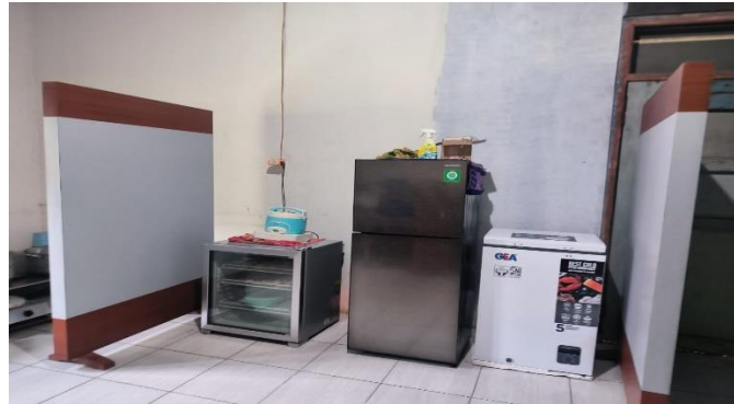
Gambar 5. Tata Layout Standar K3 Berbasis Sustainable Innovation

Program pendampingan juga mencakup penerapan Keselamatan dan Kesehatan Kerja (K3) pada proses produksi pangan. Materi yang diberikan meliputi identifikasi potensi bahaya kerja, penggunaan alat produksi secara aman, dan tindakan pencegahan kecelakaan kerja. Penataan ulang tata ruang produksi dilakukan agar proses kerja lebih efektif, aman, dan sesuai dengan standar produksi pangan. Penerapan tata letak berbasis K3 membantu meningkatkan kenyamanan dan keamanan kerja peserta selama proses produksi berlangsung.