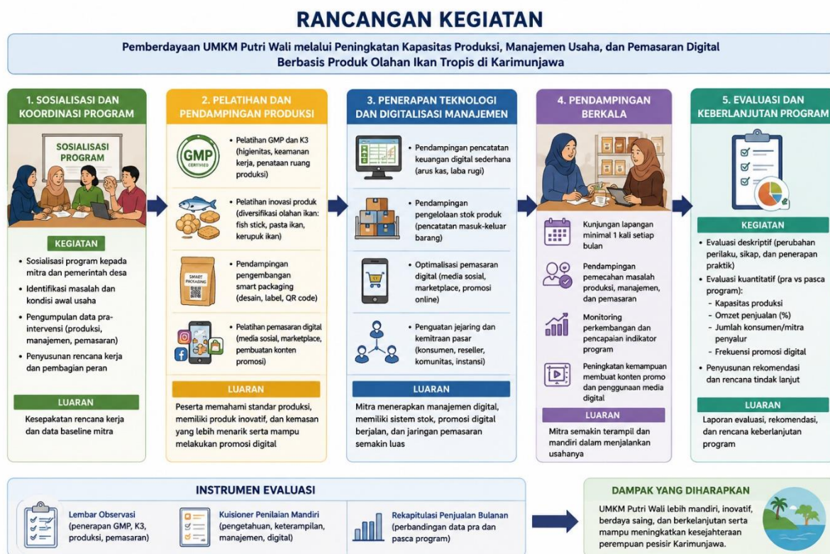
Gambar 1. Rancangan Kegiatan Pengabdian Kepada Masyarakat

Kegiatan pengabdian kepada masyarakat ini dilaksanakan di Desa Nyamuk, Karimunjawa, Kabupaten Jepara, Provinsi Jawa Tengah selama enam bulan. Sasaran kegiatan adalah UMKM Putri Wali yang beranggotakan 25 perempuan pesisir yang bergerak pada pengolahan produk berbasis ikan tropis. Metode pelaksanaan menggunakan pendekatan partisipatif kolaboratif yang menempatkan mitra sebagai subjek utama dalam setiap tahapan kegiatan. Pendekatan ini dirancang agar mitra tidak hanya menjadi penerima manfaat, tetapi juga terlibat aktif dalam proses identifikasi masalah, pelaksanaan program, hingga evaluasi kegiatan.