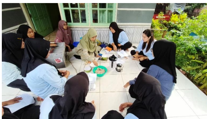
Gambar 3. Pelatihan Inovasi Olahan Ikan

Kegiatan selanjutnya berupa pelatihan inovasi dan diversifikasi produk olahan ikan. Peserta diberikan pelatihan praktik langsung dalam mengolah bahan baku lokal menjadi produk bernilai tambah seperti fish stick, pasta ikan, dan kerupuk ikan. Pelatihan dilakukan untuk meningkatkan kemampuan teknis peserta dalam pengolahan bahan baku, pengendalian kualitas produk, serta penentuan tekstur produk agar menghasilkan produk yang lebih berkualitas dan memiliki daya saing pasar. Pendekatan praktik langsung membantu peserta lebih mudah memahami tahapan produksi sehingga keterampilan dan kreativitas anggota UMKM mengalami peningkatan.