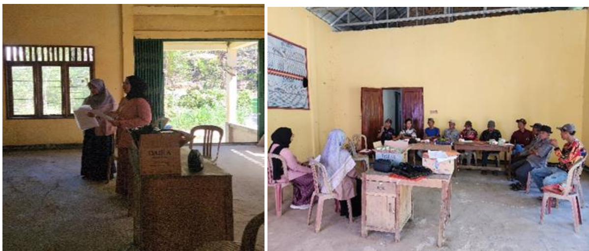
Gambar 2. Proses Pemberian Pemaparan Materi Dan Diskusi

Pelaksanaan kegiatan inti dilakukan pada tanggal 19–22 September 2024. Pada tahap persiapan ditemukan keterbatasan sarana dan prasarana pendukung kegiatan, seperti belum tersedianya balai pertemuan desa sehingga kegiatan dialihkan ke gedung PKK Desa Simpang Sender Timur. Penyesuaian tersebut diikuti dengan persiapan fasilitas pendukung seperti kursi, alat tulis, dan media penyampaian materi agar kegiatan dapat berjalan dengan baik. Kondisi ini menunjukkan bahwa keterbatasan infrastruktur di wilayah perdesaan masih menjadi tantangan dalam pelaksanaan program pemberdayaan masyarakat.