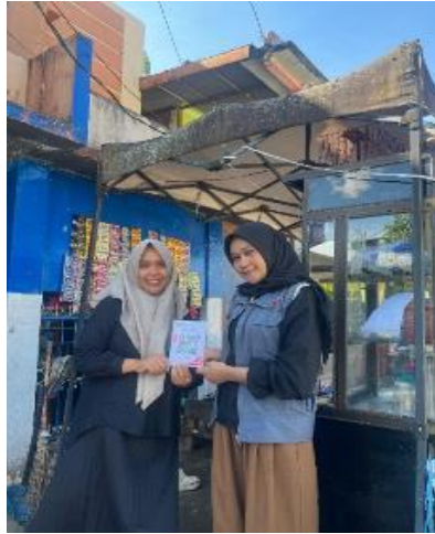
Gambar 2. Pembuatan Qris pada satu UMKM

pembayaran digital, serta penguatan aspek branding, kemasan produk, dan teknik fotografi produk sederhana. Hasil evaluasi menunjukkan bahwa mitra mampu mempraktikkan secara langsung materi yang diberikan, seperti membuat akun usaha, menyusun konten promosi digital, dan menampilkan produk secara lebih menarik. Temuan ini menunjukkan bahwa pendekatan pelatihan yang aplikatif dan berbasis praktik efektif dalam mengurangi hambatan teknis serta meningkatkan kesiapan mitra dalam mengadopsi teknologi digital.