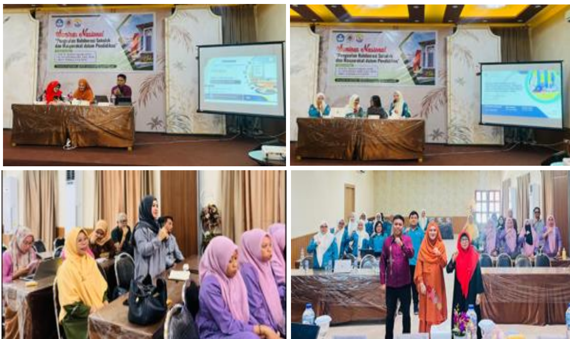
Gambar 1. Pelaksanaan Seminar Ilmiah Penguatan Kolaborasi Sekolah dan Masyarakat dalam Pendidikan

Kegiatan seminar ilmiah dilaksanakan secara partisipatif dengan melibatkan dosen, mahasiswa Pascasarjana Pendidikan Dasar, kepala sekolah, guru sekolah dasar, dan masyarakat pendidikan di Gorontalo. Kegiatan berlangsung melalui penyampaian materi, diskusi interaktif, sesi tanya jawab, dan refleksi bersama terkait penguatan kolaborasi sekolah dan masyarakat dalam pendidikan dasar.