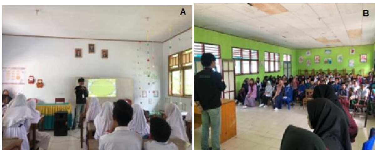
Gambar 2. (a) Kegiatan Sosialisasi pada SDN 02 Botumoito; (b) Kegiatan sosialisasi pada SMP 04 Botumoito

Kegiatan sosialisasi ini dilaksanakan pada tanggal 29 juni 2022 dan alhamdulillah telah terlaksana dengan baik dan berjalan lancar berkat dukungan dari kepala desa Hutamonu, serta aparat desa dan masyarakat desa Hutamonu. Dalam pelaksanaan pengabdian dengan tema “Upaya peningkatan pengetahuan siswa tentang pentingnya mitigasi bencana” yang dilaksanakan di SDN 02 Botumoito dan SMP 04 Botumoito menggunakan beberapa metode diantaranya kegiatan sosialisasi dan pemasangan spanduk. Dengan adanya kegiatan sosialisasi ini siswa-siswi banyak menambah pengetahuan dan pembelajaran yang di peroleh diantaranya adalah pengetahuan tentang mitigasi bencana mengingat SDN 02 Botumoito dan SMP 04 Botumoito belum pernah mendapatkan kegiatan sosialisasi tentang mitigasi bencana alam sehingga kegiatan sosialisasi ini sangat bermanfaat bagi siswa-siswi yang ada pada lokasi pengabdian, Khususnya siswa SDN 02 Botumoito dan SMP 04 Botumoito.