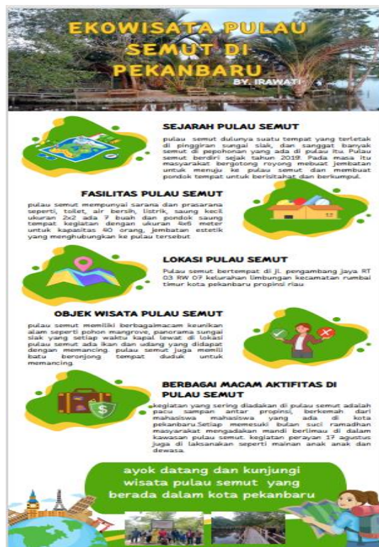
Gambar 4. Hasil Infografis Karya Mitra

membantu mitra untuk dapat melanjutkan kembali pembuatan infografis di rumah mitra. Modul praktik sangat membantu mitra untuk dapat mengulangi kembali kegiatan secara efektif (Maryam et al. , 2022).