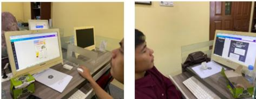
Gambar 3. Kegiatan Pembuatan Infografis

Sebelum penyuluhan, secara umum mitra belum mengetahui konsep infografis, bagian dan contoh dari infografis. Setelah penyuluhan, mitra menjadi paham akan hal tersebut. Dengan adanya bantuan penyampaian dengan bahasa yang sederhana, pemanfaatan proyektor dan penyajian contoh dari beberapa jenis infografis yang dijelaskan oleh tim pengabdian membuat mitra mudah memahami materi mengenai infografis. Selama ini, mitra hanya memanfaatkan gambar sebagai konten sosial media, setelah mengetahui infografis mitra dapat memanfaatkan gambar menjadi salah satu data yang disajikan dengan menarik yang dapat memberikan informasi kepada pengunjung dan pembaca sosial media Pulau Semut.