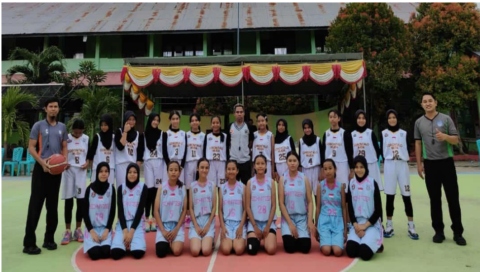
Gambar 1. Praktek Peraturan Permainan Bola Basket

Kegiatan interaktif menjadi momen krusial untuk memperkuat pemahaman siswa. Pemutaran video permainan bola basket memberikan dimensi praktis dan nyata terhadap aturan permainan yang telah dijelaskan sebelumnya. Sesi tanya jawab yang dilanjutkan memungkinkan siswa untuk berpartisipasi aktif dan mengklarifikasi keraguan mereka, bertujuan meningkatkan keterlibatan siswa serta memastikan pemahaman mereka yang lebih mendalam.