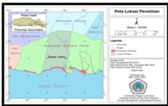
Gambar 1 Peta lokasi penelitian

Penelitian ini dilaksanakan di Perairan Teluk Tomini Desa Lamu Kecamatan Batudaa Pantai Kabupaten Gorontalo.