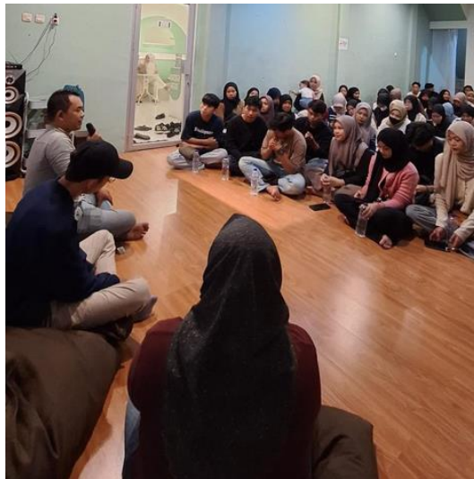
Gambar 3. Penyampaian materi tentang budaya 'Panggoba' dan elemen-elemen sinematografi

Di dalam pembuatan film pun, suhu warna cahaya yang umumnya dikenal dengan warm tone dan cool tone di dalam dunia skincare dan make up pun secara langsung memengaruhi rona warna yang terlihat pada kamera. Intensitas cahaya memengaruhi saturasi dan kecerahan warna. Warna bisa terlihat berbeda di bawah cahaya keras dibandingkan cahaya lembut. Sebagai contoh, cahaya matahari terbenam yang memancarkan warm tone akan memberikan nuansa oranye-kemerahan pada kulit dan lingkungan, sementara cahaya neon sebagai cool tone akan menghasilkan nuansa kehijauan.