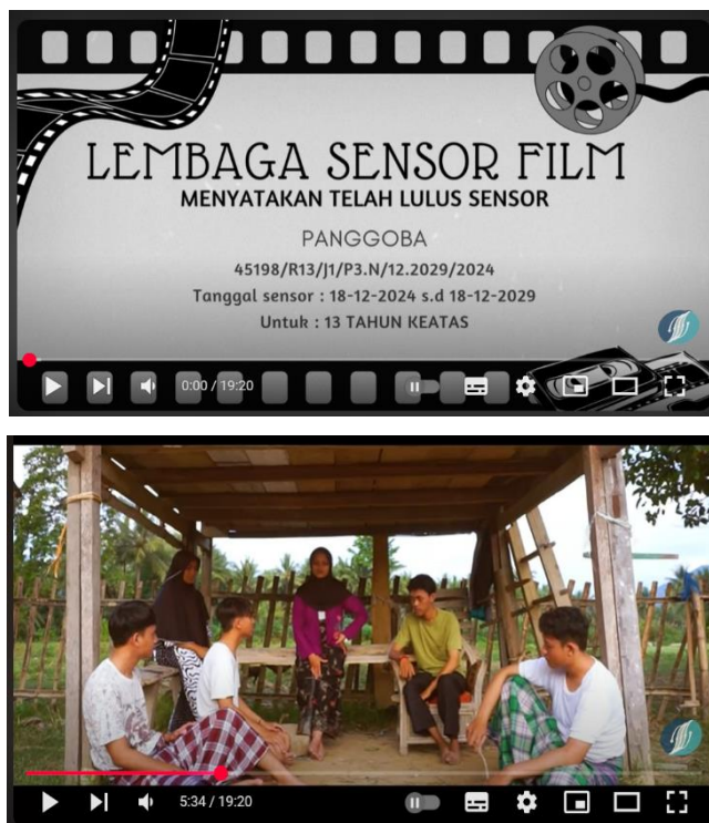
Gambar 1. Film “Panggoba” yang dibedah pada kegiatan pengabdian kepada Masyarakat

karena film tersebut mampu memicu diskusi kepada para peserta, serta kualitas produksi dari film pendek tersebut memadai untuk dianalisis.