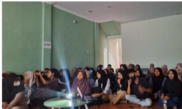
Gambar 2. Peserta kegiatan pengabdian kepada masyarakat menonton film pendek “Panggoba”

Ilmu ‘Panggoba’ tidak hanya terpaku pada bintang, tetapi juga melibatkan kemampuan membaca tanda-tanda alam lainnya yang bisa memengaruhi pertanian, seperti perubahan cuaca atau perilaku hewan. Ketika mencegah dan membasmi hama, ‘Panggoba’ juga memiliki pengetahuan lokal tentang cara membasmi hama tanaman menggunakan bahan-bahan alami, seperti kayu cendana, air kelapa muda, atau batu kemenyan. Kegiatan ini adalah bentuk kearifan lokal dalam menjaga keberlangsungan pertanian tanpa bergantung pada bahan kimia.