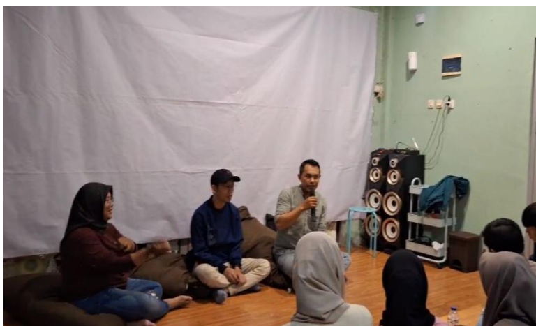
Gambar 5. Kegiatan tanya dan jawab pada kegiatan bedah film

melestarikan praktik 'Panggoba' ini untuk menunjukkan pentingnya kearifan lokal dalam sistem pertanian di Gorontalo. 'Panggoba' adalah contoh nyata bagaimana masyarakat tradisional berinteraksi dan beradaptasi dengan lingkungan mereka melalui pengamatan yang cermat dan pengetahuan yang diwariskan secara turun-temurun.