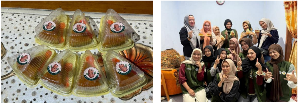
Gambar 2. Inovasi “Bika Singkong”

Sebagai Langkah Place Branding , dikembangkan sebuah Platform Digital berbasis laman yang digunakan untuk memperkenalkan Desa Duano secara lebih luas. Penggunaan platform digital ini sebagai bentuk adaptasi terhadap zaman yang semakin canggih, sehingga potensi desa dapat dipromosikan tidak hanya secara lokal, tetapi juga menjangkau pasar nasional bahkan internasional.