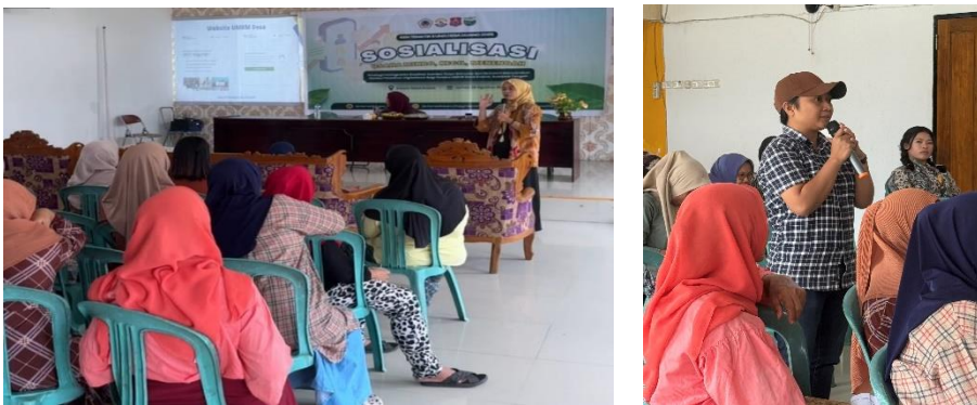
Gambar 1. Pemaparan Materi Pelatihan Digitalisasi Bagi Pelaku UMKM

Salah satu hasil utama dari kegiatan ini adalah meningkatnya pemahaman peserta mengenai pentingnya digitalisasi. Peserta, khususnya pelaku UMKM, mulai menyadari peran digitalisasi dalam memperkenalkan produk yang mereka jual. Hasil pre-test dan post-test menunjukkan adanya peningkatan pemahaman masyarakat sebelum dan sesudah kegiatan berlangsung.