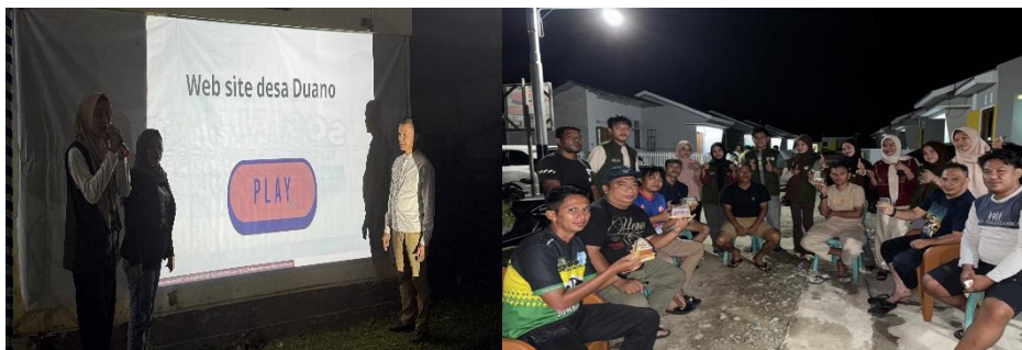
Gambar 4. Launching produk dan laman desa

dampak yang positif sebagai upaya meningkatkan daya saing desa di era digital. Selain itu, dikembangkan produk “Bika Singkong Duano” sebagai inovasi produk berbasis potensi lokal.