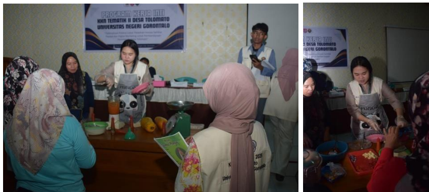
Gambar 2. Pelatihan Pembuatan Olahan Papaya Menjadi Sambal

Dari kegiatan ini, ada beberapa pencapaian nyata bisa dicatat. Pertama, peserta kini memahami cara mengolah olahan papaya dan mampu memproduksinya menjadi barang yang punya nilai jual. Kedua, masyarakat memperoleh keterampilan pengolahan pangan lokal yang berpotensi menambah pendapatan keluarga. Ketiga, pengetahuan tentang digital marketing termasuk memanfaatkan media sosial seperti WhatsApp, Facebook, dan Instagram untuk promosi yang efektif menjadi bekal baru bagi para masyarakat di Desa Tolomato.