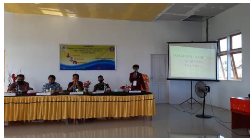
Gambar 1.2 Penyuluhan Stunting