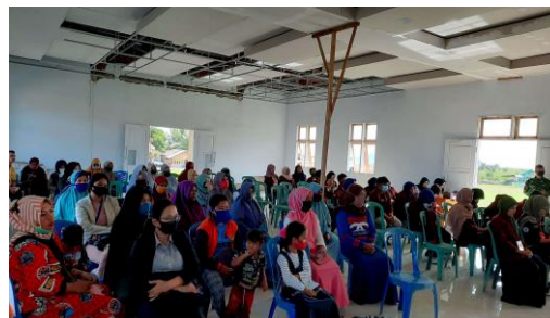
Gambar 1.3 Potret Peserta Penyuluhan

Hal yang dapat dilakukan pada ibu hamil demi mencegah terjadinya stunting pada anak antara lain: