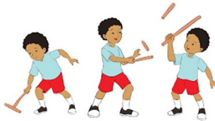
Gambar 2.1 Contoh Permainan Patok lele

Permainan Tradisional Patok Lele Permainan ini dilakukan oleh anak laki-laki berusia 8-13 tahun. Permainan ini dilakukan secara kelompok dengan jumlah pemainnya lebih dari 2 orang dan berjumlah genap. Paling sedikit jumlah pemainnya 2 orang. Permainan ini biasa dimainkan di lapangan pada waktu pagi, siang atau sore hari dan waktu-waktu tertentu. Nilai-nilai yang terkandung dalam permainan patok lele ini antara lain: sportivitas, keamanan, keterampilan, dan kecermatan.